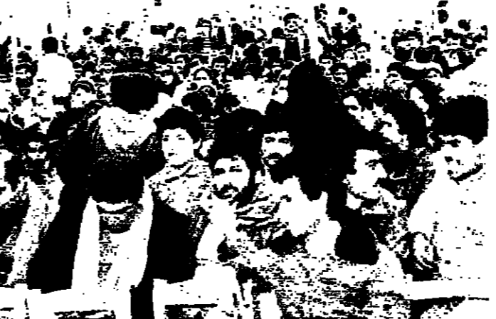
البارد - الانوار: اقامت الجبهة الديمقراطية لتحرير فلسطين في الشمال امس مهرجانها الختامي بمناسبة الذكرى السنوية لانتقلالها في شماليه في اقليم البارد بحضور ممثلين عن المنظمات الفلسطينية وبعثة التنسيق السياسي والاجزاب الوطنية والتعمية وجيش لبنان العربي وحشد من اهالي المخيم. وفي الصورة جانب من الاحتفال.